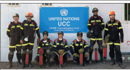
Bombeiros participam em exercício

Venha provar o que de melhor preparamos para si! Largo dos Combatentes, nº 15 2050-099 Aveiras de Cima 263 475 381 (estacionamento privado)